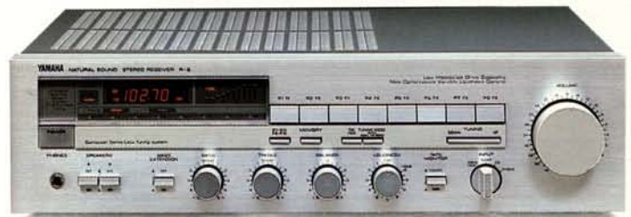
auch in Schwarz erhältlich

Als Steuergerät mit besonderen musikalischen Qualitäten erfreut der R-5 durch ein ausgezeichnetes Preis/Leistungsverhältnis. 2 x 50 Watt stehen zur exakten Verarbeitung dynamischer Musikimpulse bereit. Digitale Aufzeichnungen, die manchen Receiver auf die Probe stellen, werden in natürlicher Dynamik wiedergegeben. Stabile Arbeitsweise im Bereich niedriger Impedanzen gestattet die präzise Ansteuerung auch kritischer Lautsprecher. Durch Detailverfeinerung entstand Yamahas neuartige stufenlos regelbare Loudness mit verbesserter Wiedergabecharakteristik und größerem Dämpfungsbereich (bis 40 dB). Sie wirkt auch bei erhöhten Wiedergabepegeln und einem breiteren Lautstärke-Regelbereich. Eine Schaltung zur Verstärkung im Baßbereich kompensiert die Schwächen kleiner Lautsprecher und verleiht ihnen die Leistungsfähigkeit weitaus größerer Systeme. Die neuartige Computer Servo Lock-Abstimmung gewährleistet optimalen Rundfunkempfang und präzise Synthesizer-Abstimmung. 16 Stationsspeicher, die in beliebiger Folge belegt und ohne Bandumschaltung abgerufen werden können, Sendersuchlauf und manuelle Abstimmung, demonstrieren höchsten Bedienungskomfort. Für 2 Lautsprecherpaare stehen schaltbare Ausgänge zur Verfügung.