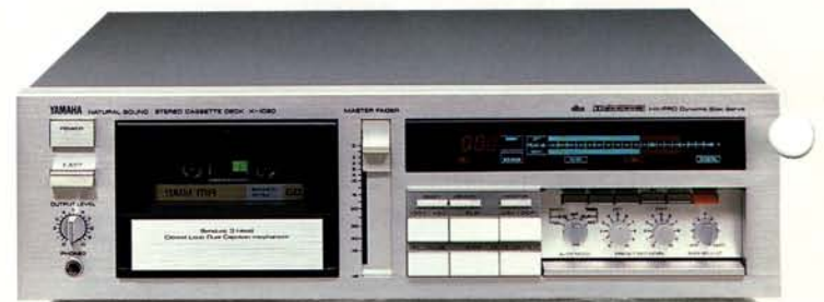
auch in Schwarz erhältlich

Als Flaggschiff einer anspruchsvollen Reihe von Kassetendecks ist das K-1020 durch zahlreiche technische Besonderheiten auf maximale Aufnahmequalität und hohen Bedienungskomfort ausgelegt. Dual Capstan-Antrieb mit geschlossener Regelschleife, und Yamahas Tonköpfe aus Sendust höchster Reinheit, gewährleisten ultrapräzisen, stabilen Bandtransport und linearen Frequenzgang über einen großen Bereich. Zur vollständigen Kompatibilität mit jeglichen Rauschunterdrückungssystemen stehen Dolby B und C sowie dbx jeweils doppelt zur Verfügung. Der große Dynamikbereich von Dolby C und dbx gestattet perfekte Aufzeichnungen digitaler Aufnahmen. Eine weitere Qualitätssteigerung bewirkt das HX Professional Dynamic Bias Servo-System. Aussteuerungsinstrumente mit Leuchtbalken zeigen in Abhängigkeit des eingelegten Bandtyps, und des vorgewählten Rauschunterdrückungssystems die empfohlene Maximalaussteuerung automatisch an. Vielseitige Ausstattung wie Master Fader mit separater Balance und Vor- bzw. Rückspulen in zwei Geschwindigkeiten, prägt das Erscheinungsbild eines Kassetendecks der absoluten Spitzenklasse.