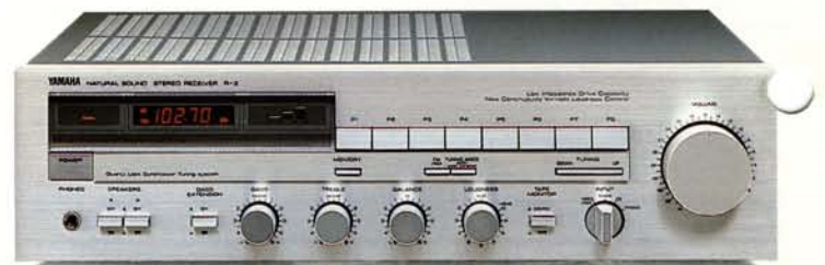
auch in Schwarz erhältlich

Als Basismodell einer anspruchsvollen Receiver-Baureihe ist der R-3 durch Klang und Komfort die Herausforderung in seiner Leistungsklasse. 2 x 35 Watt gewährleisten dynamische Signalverarbeitung auch anspruchsvoller digitaler Aufzeichnungen. Durch besondere Stabilität im Bereich niedriger Impedanzen zeigt er sich sämtlichen Lautsprechersystemen gewachsen. Kleine Lautsprecher erhalten durch Yamahas exklusive Schaltung zur Baßverstärkung das, Klangvolumen größerer Systeme. Die neuartige stufenlos regelbare Loudness gestattet subtile Klangkorrektur bei jeder gewünschten Lautstärke. Das Tunerteil profitiert vom neuentwickelten IF Count PLL Synthesizer-Abstimmsystem äußerster Präzision. Sendersuchlauf und je 8 Speicher für UKW- oder MW-Stationen sind komfortable Details. Weitere sinnvolle Ausstattungsmerkmale finden sich in der manuellen Senderabstimmung und in den schaltbaren Anschlüssen für zwei Lautsprecherpaare.