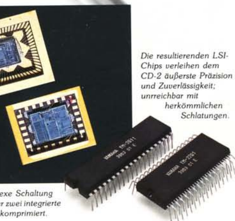
Die resultierenden LSI-Chips verleihen dem CD-2 äußerste Präzision und Zuverlässigkeit; unreichbar mit herkömmlichen Schaltungen.