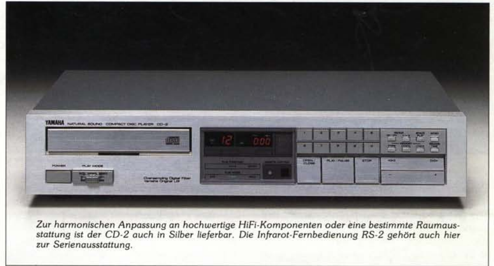
Zur harmonischen Anpassung an hochwertige HiFi-Komponenten oder eine bestimmte Raumausstattung ist der CD-2 auch in Silber lieferbar. Die Infrarot-Fernbedienung RS-2 gehört auch hier zur Serienausstattung.